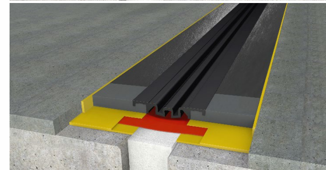
CPS Mono 20/80