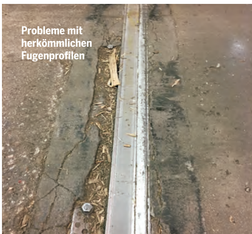
Probleme mit herkömmlichen Fugenprofilen

Sind die eingebauten Bodenprofile nicht plan, entstehen neben Lärm auch hohe Stoßbelastungen an den Radlagern und nicht zuletzt auf den Rücken der Staplerfahrer. Krankenstände und teure Reparaturen an Flurförderfahrzeugen (Stapler, Hubwagen etc.) können die Folge sein.